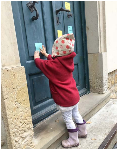
Am Reformationstag klebten wir unsere eigenen Thesen an die Pfarrhaustür in Bad Lauchstädt