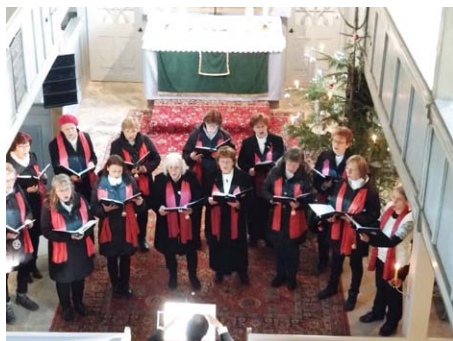
Weihnachtslieder mit Cantamus

OBEREICHSTÄDT. Am dritten Advent füllte der Chor Cantamus aus Obhausen unter der Leitung von Herrn Dalitz die Kirche in Obereichstädt mit deutschen und internationalen weihnachtlichen Klängen.