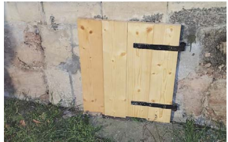
Neue Tür für die Krypta

ST. JAKOBI. Bereits zum Stadtfest hatten Unbekannte die kleine Außentür zur Krypta an der Stadtkirche St. Jakobi zerstört. Da aber nichts weiter gestohlen wurde, kam die Versicherung für den Schaden nicht auf.