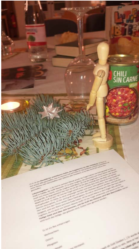
Theologischer Abend

ST. JAKOBI. Einfach eine gute Mischung: nette Getränke, spannende Menschen und kluge Gedanken über Gott, die Bibel und uns. Wir haben das Buch der Bücher durchforstet und nachgelesen, in welcher Körperhaltung die Menschen damals beteten. Zu unserer Überraschung hat kein einziger von ihnen die Hände gefaltet.