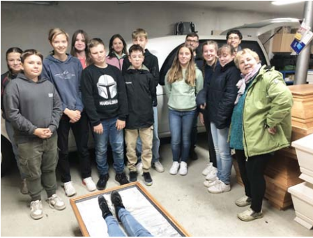
Konfirmanden beim Bestatter Abendfrieden in Bad Lauchstädt