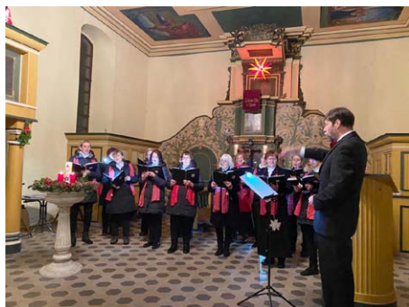
Konzert in der Kirche Schmirma

SCHMIRMA. Gleich das erste Türchen des lebendigen Adventskalenders der Stadt Mücheln öffnete sich in Schmirma, in der bezaubernden Dorfkirche. Dazu war eigens der Chor "Cantamus" aus Obhausen angereist. So konnte nun beides an diesem frühen Adventsabend mit einem gemütlichen Beisammensein ausklingen. Kalender und Konzert. Ein Format, das sich lohnt, es zu wiederholen.