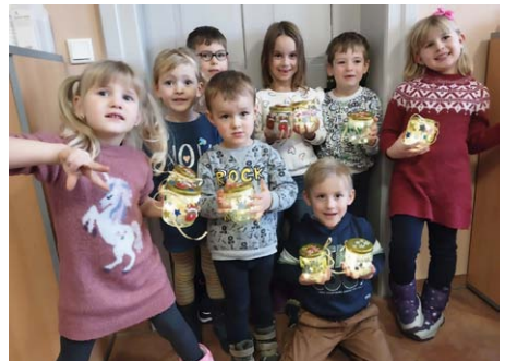
In der Minikirche bastelten wir im Dezember weihnachtliche Dekoration mit Lichtern.