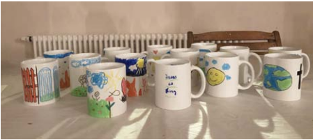
Konfirmanden gestalten ihre eigenen Tassen zum Thema Himmel und Hölle.

Unsere Jugendlichen werden von der Kirchengemeinde auf die Spurensuche nach Gott geschickt. Dabei konnten wir in Bad Lauchstädt im Bestattungshaus Abendfrieden alles, wirklich alles, fragen, was uns zum Thema Tod und Bestattung auf der Seele brannte. Außerdem durfte jeder, der wollte, einmal im Sarg probeliegen.