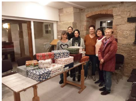
Weihnachten im Schuhkarton in Schnellroda

SCHNELLRODA. Schon am 1. November trafen sich Jung & Alt in der Winterkirche in Schnellroda um 25 Päckchen für bedürftige Kinder zu packen. Gern können Sie auch jetzt schon übers Jahr kleine Schätze für die nächste Aktion sammeln. Herzlichen Dank an alle Beteiligten.