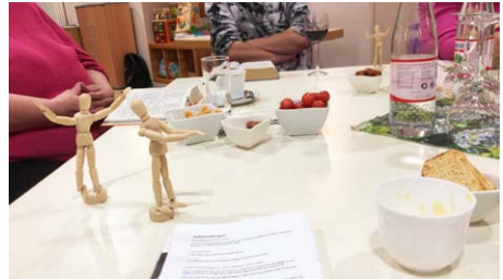
Theologischer Abend zum Thema Gebetshaltungen

ST. JAKOBI. Einfach eine gute Mischung: nette Getränke, spannende Menschen und kluge Gedanken über Gott, die Bibel und uns. Wir haben das Buch der Bücher durchforstet und nachgelesen, in welcher Körperhaltung die Menschen damals beteten. Zu unserer Überraschung hat kein einziger von ihnen die Hände gefaltet.