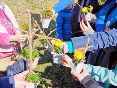
Zum Osterfest erwacht das Leben, auch das der Pflänzchen. Wir verzierten sie mit einem Osterkreuz aus Stöckchen.

MÜCHELN. Im April suchten wir im Schlosspark St. Ulrich nach Ostereiern, die der Osterhase dort versteckt hatte. Aus kleinen Stöckchen bastelten wir vor Ort ein Osterkreuz und konnten ein kleines Pflänzchen damit verzieren, was jeder mit nach Hause nehmen konnte.