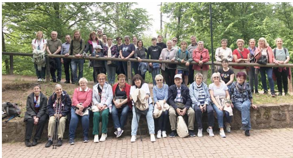
Mit dem Bus zur Wartburg – da waren viele dabei.