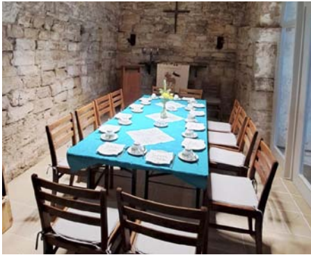
Die Winterkirche kann auch in der kalten Jahreszeit genutzt werden.

Ein Jahrzehnt Bauzeit für einen besonderen Raum