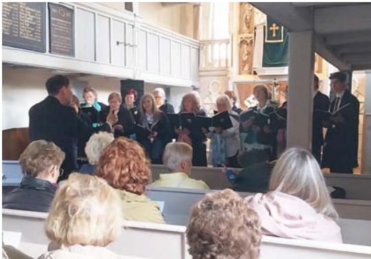
Der Chor „Cantamus“ stimmte bekannte Frühlingslieder an.

OBEREICHSTÄDT. Bekannte Frühlingslieder erklangen am 17. Mai in der Kirche St. Nikolai in Obereich-