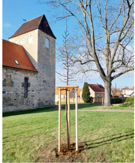
Winterlinde an der Kirche St. Wenzel

Bereits im März hatte Werther, der bei der Stadt Mücheln für das Grünflä-