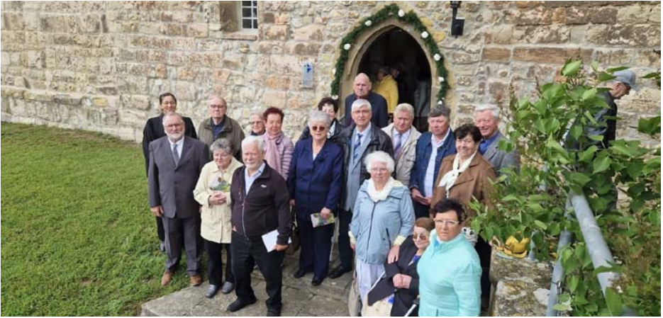
Die Diamantenen Konfirmanden